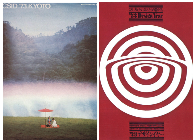
図 1 '73 世界デザイン会議と '73 デザインイヤーのポスター (左デザイン：永井一正；右デザイン：亀倉雄策)

「世界インダストリアルデザイン会議 ICSID '73 KYOTO」は、10 月 11 日から 13 日の 3 日間、「人の心と物の世界」をテーマに京都で開催された (図 1)。ICSID は、ヨーロッパを中心に活動してきた団体であるため、日本開催を決めた 1969 年 ICSID ロンドン大会において、榮久庵憲司は「アジアで開催しないなら、あなた方の地球は平たいままである」と発言したとの逸話が残っている。この発言からも、日本からのデザイン思想の発信の機会を得よう、日本を認めさせようとする意図が窺えよう。WDO はそのサイトに、「(京都デザイン会議は) 架け橋としての ICSID の役割を強化した。西洋とアジアのデザイン界がアジアの地で初めて一堂に会するという点で、組織にとって革命的なものであった」と記載している。